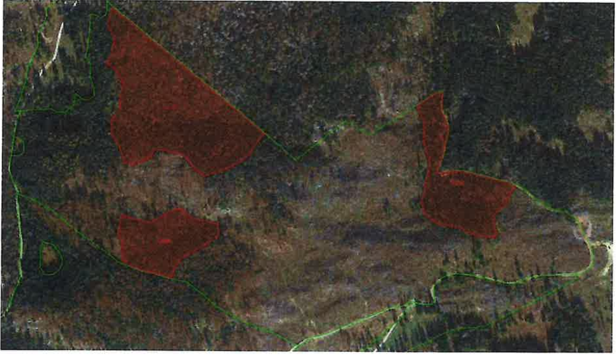
Particella 53 Busa Menotto